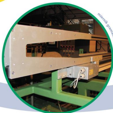
miernik gramatury IR